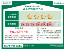
省エネ性能ラベル